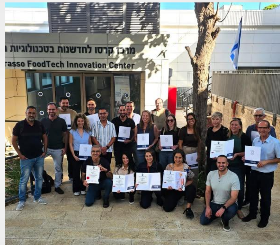
עובדי תנובה בטכניון: קורס חדשנות מדעית וטכנולוגית בהנדסת מזון, לטכנולוגי מזון