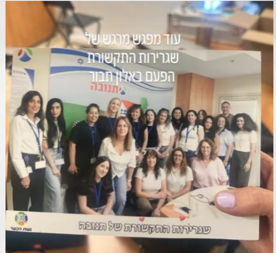
השגרירות בתמונה קבוצתית