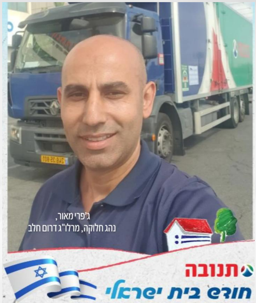
סיפורו של נהג בתנובה שעלה ארצה מאירן!