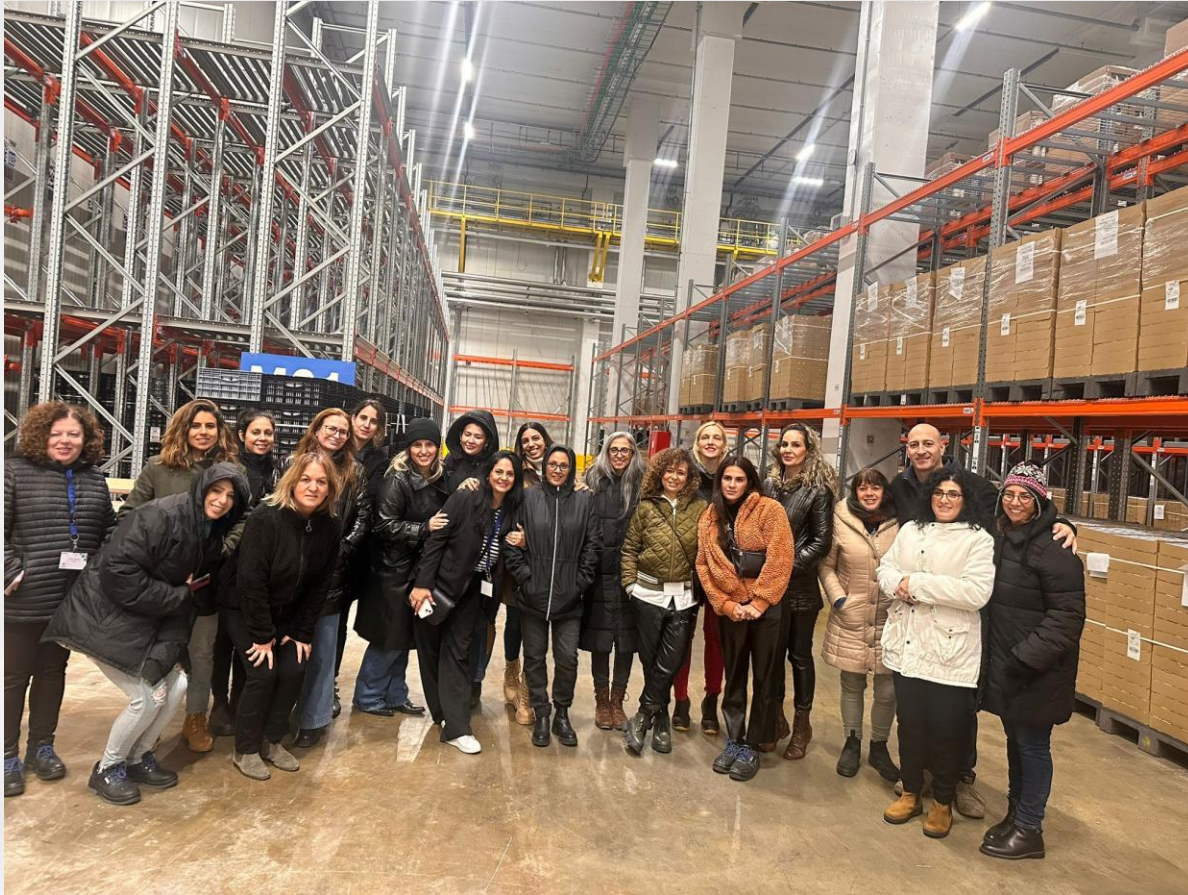
שגרירות התקשורת בסיור במרלוג צפון