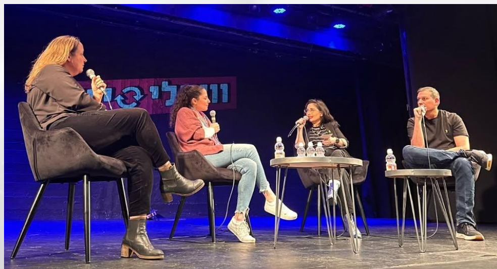
מנהלות מתנובה באירוע האופסייט של פודקאסט החדשנות- @weeklyncpodcast