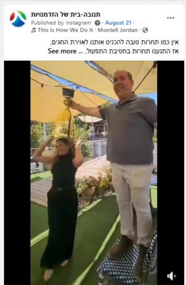
סרטון המציג בצורה הומוריסטית את תחרות התפעול בין כל המחלבות והמפעלים