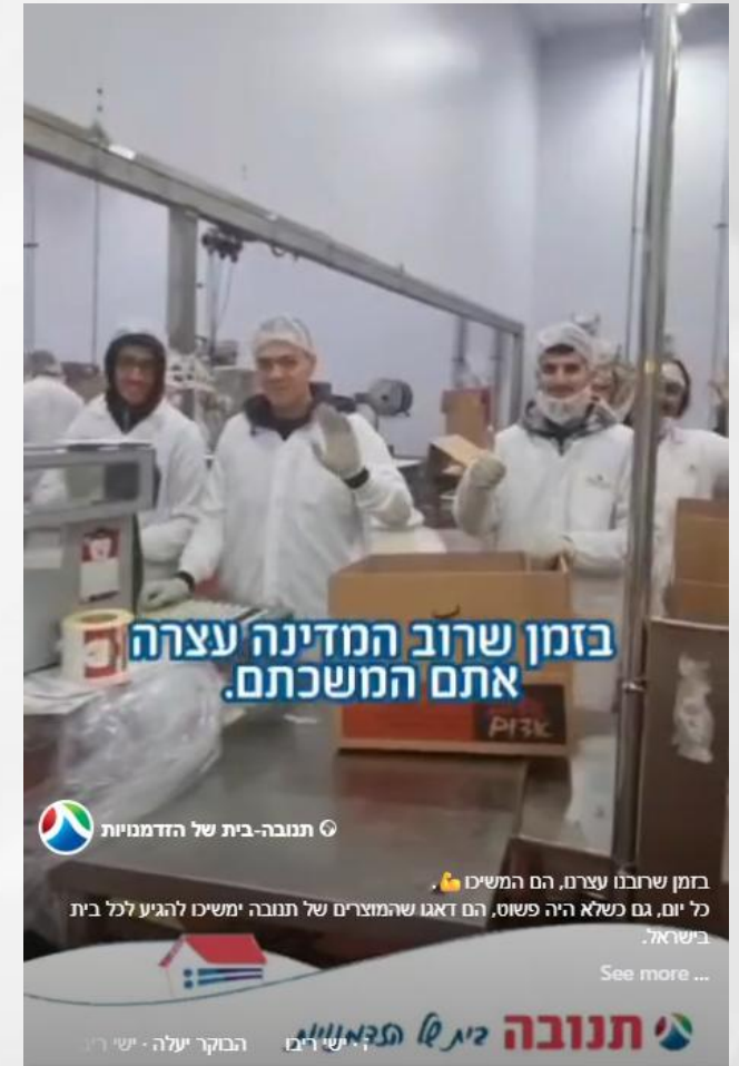
מצדיעים לעובדים שהמשיכו לעבוד בזמן המלחמה עם אירן