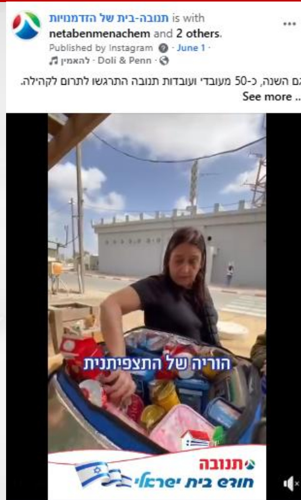
שגרירי תנובה בקהילה- לכבוד שבועות, 50 עובדים בוחרים למי להעניק טנא תנובה