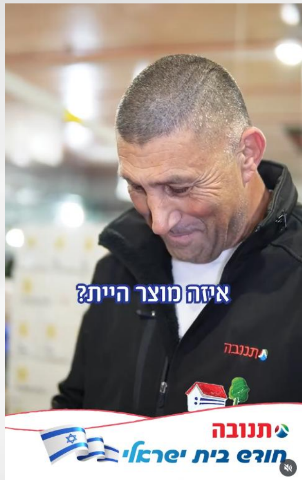
סרטון "אם היית מוצר של תנובה..."