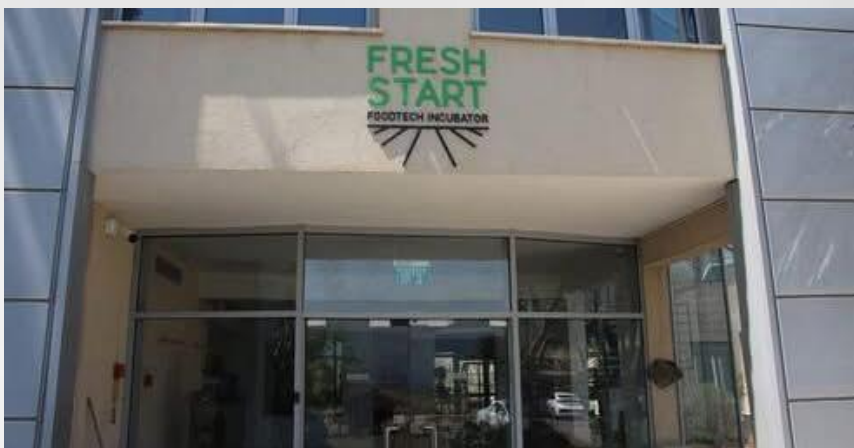
חממת החדשנות והפודטק בקריית שמונה