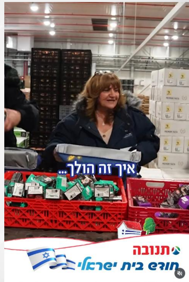
סרטון "ארזתם לבד?" אריזת צידניות במתנה לעובדים