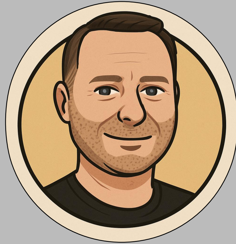
Operational Risk Manager