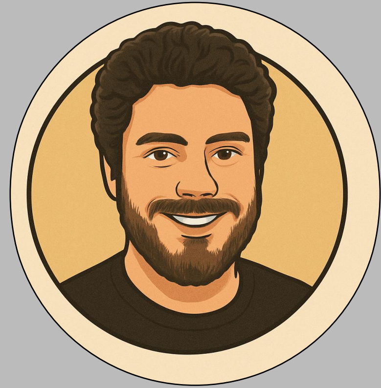
Head of Architecture