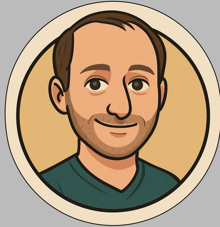
Head of IT