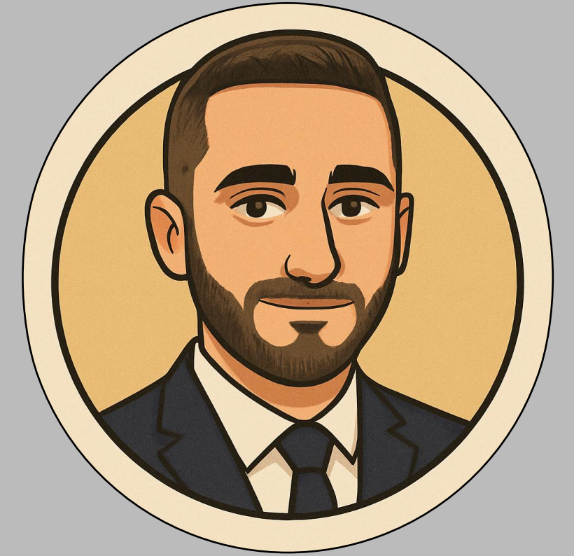
Head of AI